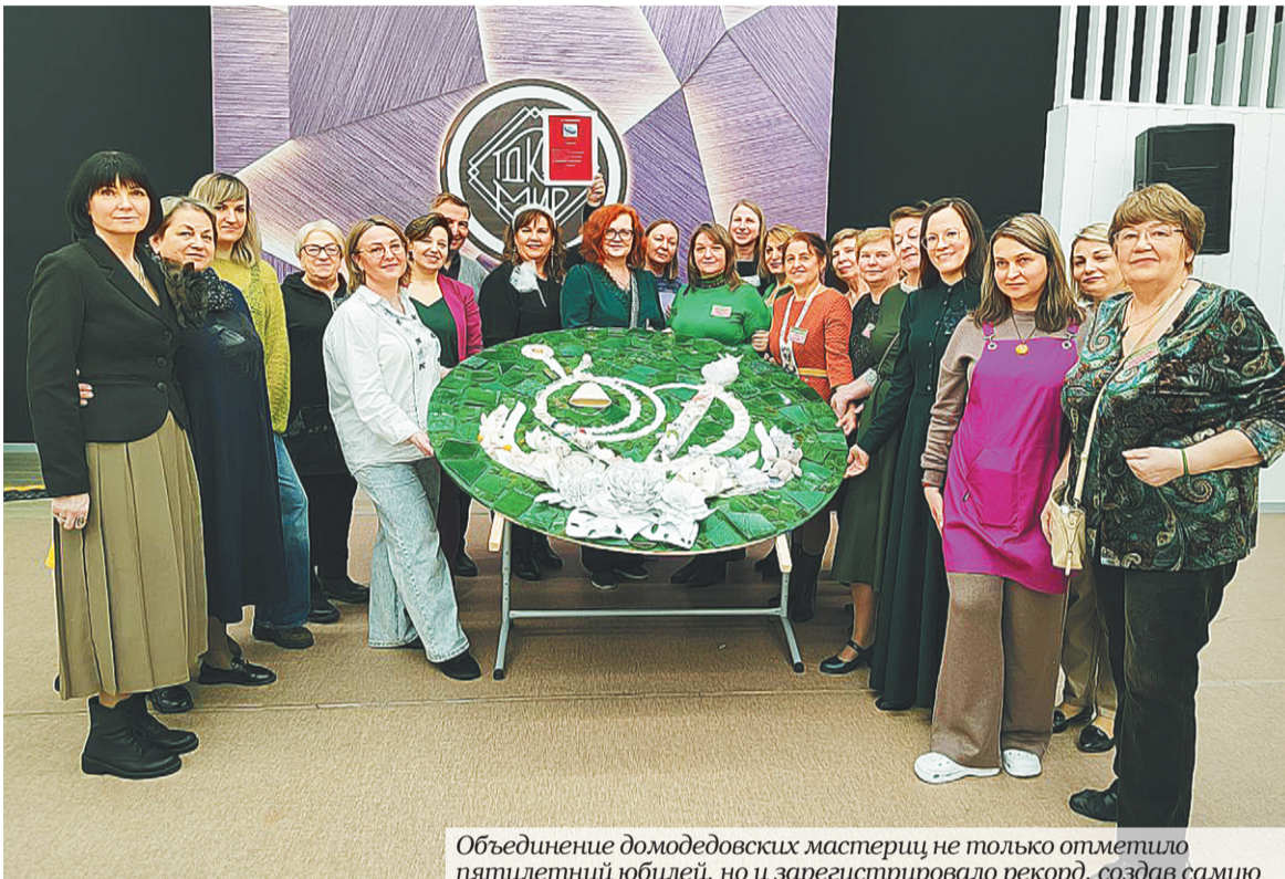
Объединение домодедовских мастериц не только отметило пятилетний юбилей, но и зарегистрировало рекорд, создав самую большую брошь в мире. /

Сообщество домодедовских мастериц «Лига мастеров Домодедово» отметило пятилетний юбилей и установило рекорд