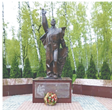
Монумент на территории Госфильмофонда РФ. /