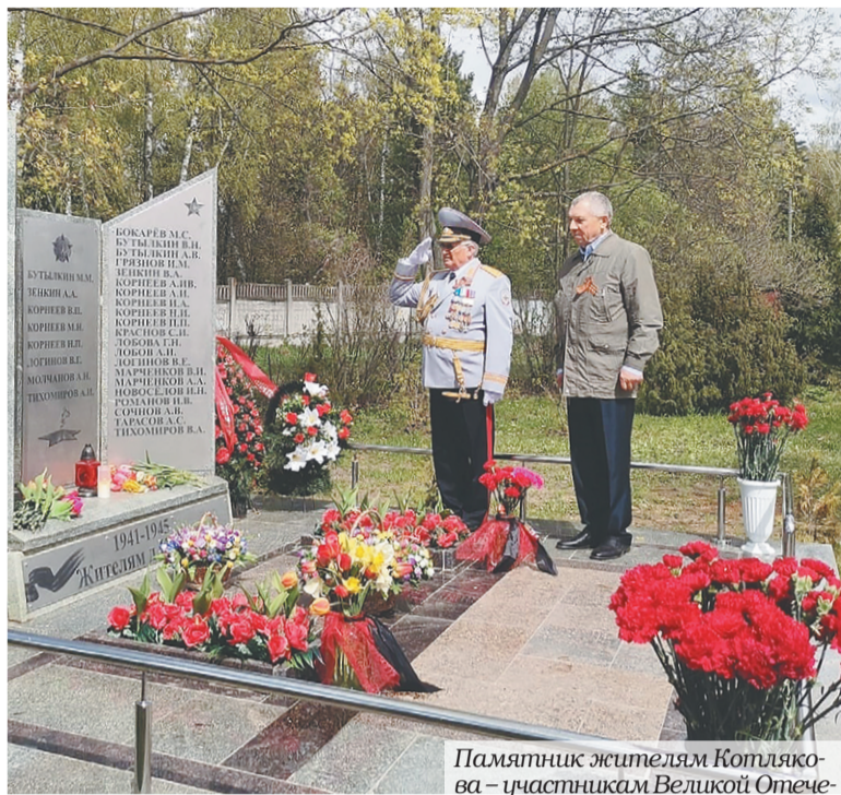
Памятник жителям Котляково – участникам Великой Отечественной войны. /