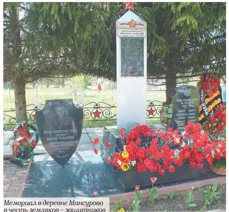
Мемориал в деревне Мансурово в честь земляков – защитников Родины в годы Великой Отечественной войны. /

История – очень многогранная наука. Она информирует нас о прошлом, позволяет лучше понять традиции, ценности общества и сформировать такое ёмкое понятие, как историческая память. Помогают сохранять информацию о значимых событиях или героических личностях памятные знаки. О них и пойдёт речь в этом материале.