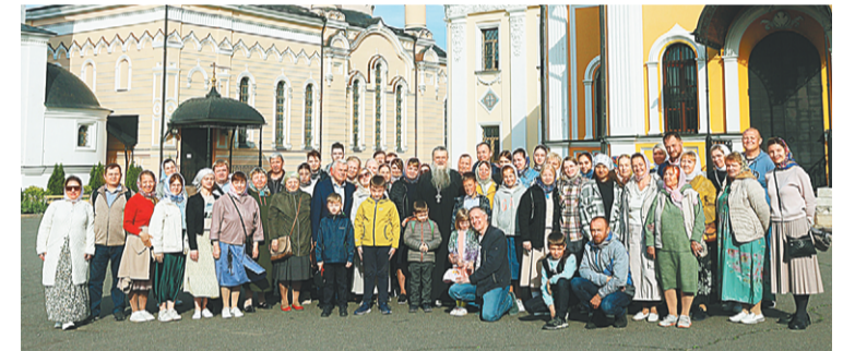
Паломники в Давидовой пустыни