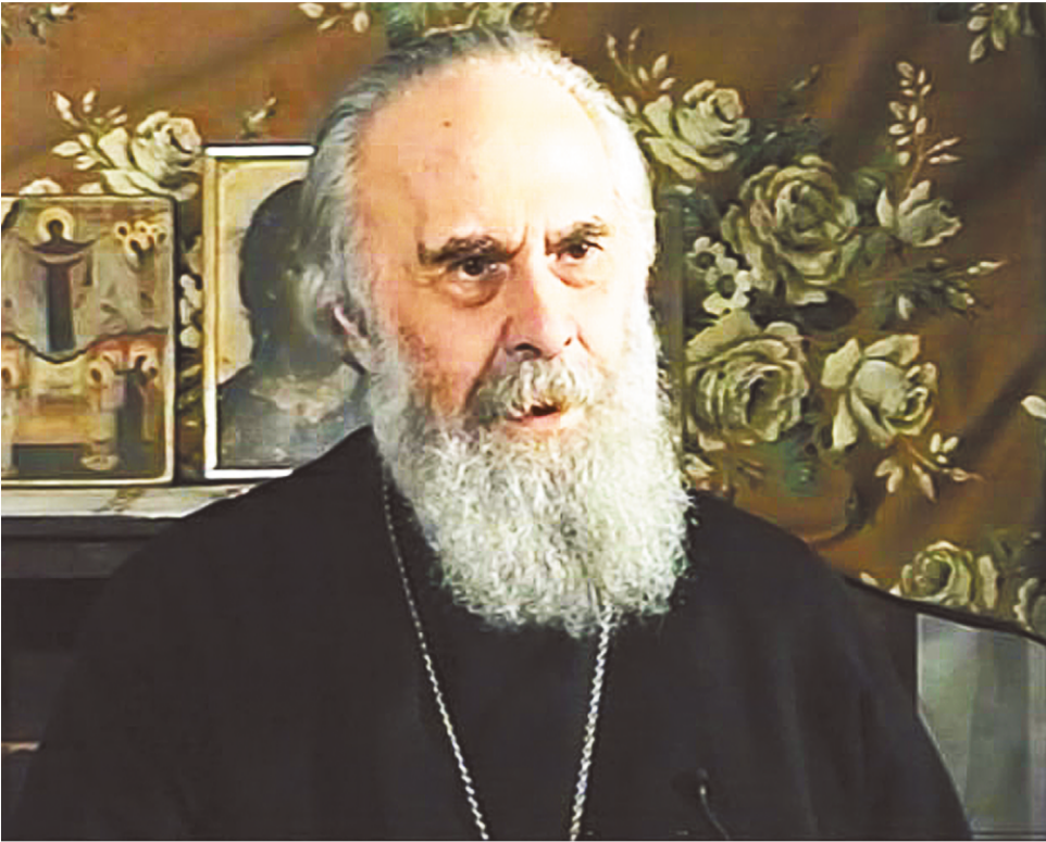
Митрополит Антоний Сурожский

Брак – чудо на земле. В мире, где всё идет вразброд, брак – место, где два человека, благодаря тому, что они друг друга полюбили, становятся едиными, место, где рознь кончается, где начинается осуществление единой жизни. И в этом самое большое чудо человеческих отношений: двое вдруг делаются одной личностью, два лица вдруг, потому что они полюбили и приняли друг друга до конца, совершенно, оказываются чем-то большим, чем двоица, чем просто два человека, – оказываются единством.