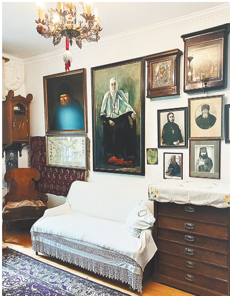
В кабинете-музее схиигумении Фамари.

Следующий номер газеты «Призыв» выйдет 4 июля 2023 г.