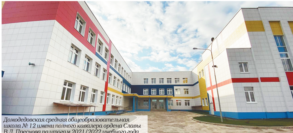
Домодедовская средняя общеобразовательная школа № 12 имени полного кавалера ордена Славы В.Д. Преснова по итогам 2021/2022 учебного года вошла в топ-100 школ по Московской области. /

В сельском доме культуры «Пахра» прошла очередная встреча с родительской общественностью