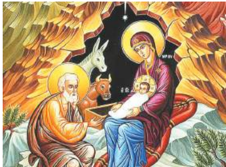
Рождество Христово. Икона