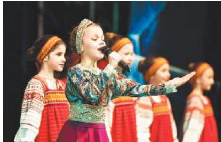
Во время концерта