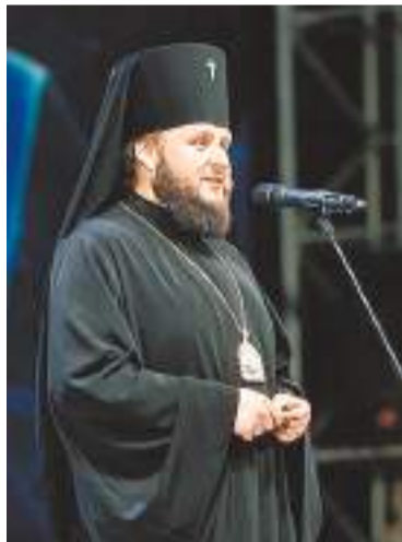
Приветствие владыки Аксия