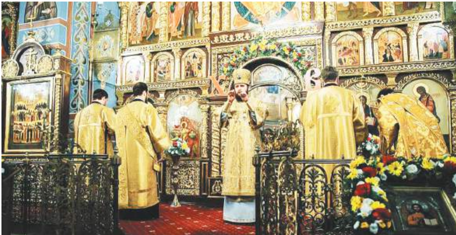
Архиепископ Подольский и Люберецкий Аксий во время богослужения

Архиерейская служба в соборе Всех святых, в земле Русской просиявших, города Домодедово