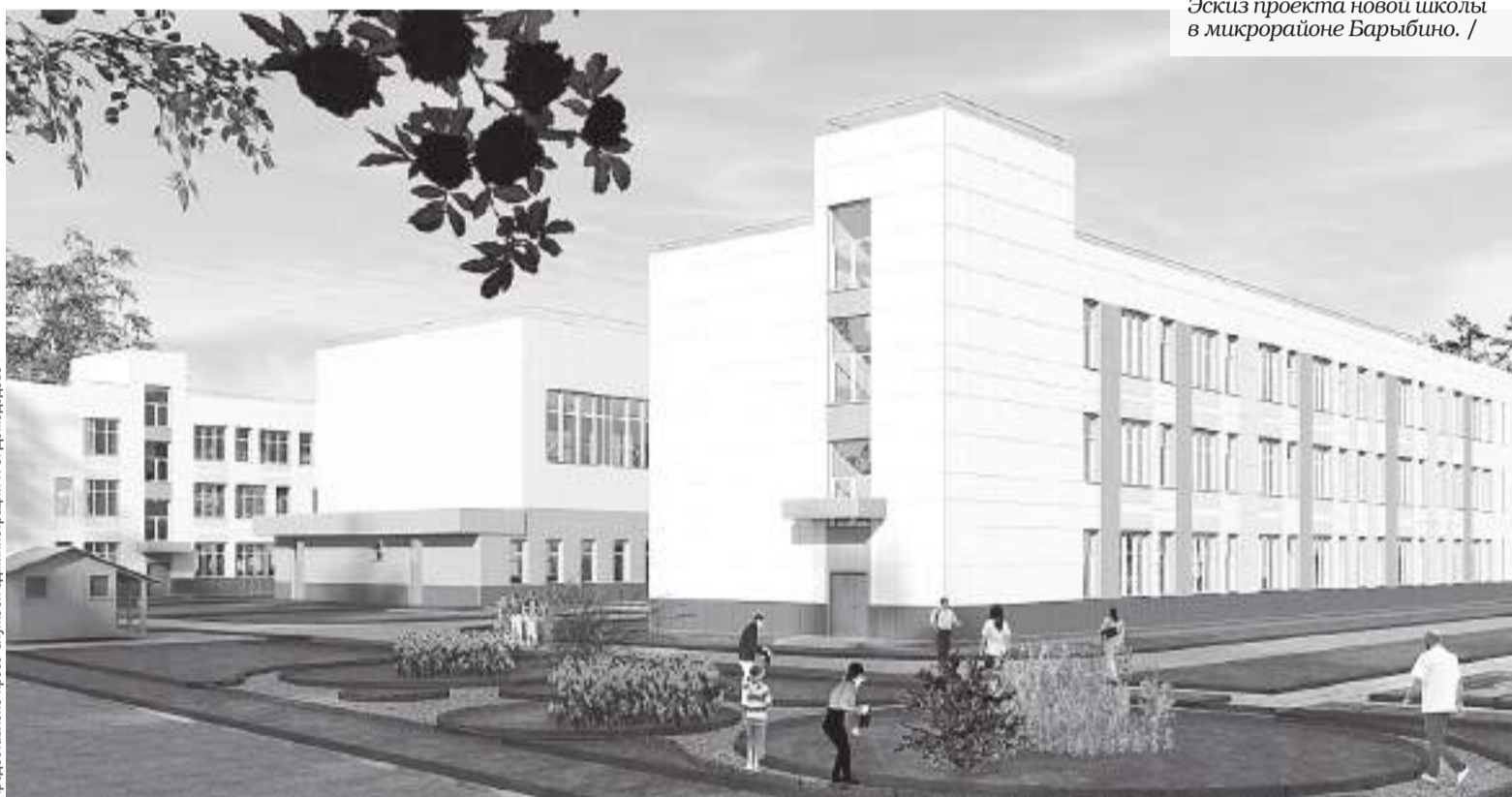
Эскиз проекта новой школы в микрорайоне Барыбино. /

При этом по каждому объекту предусмотрен дизайн-проект, который будет согласовываться с заказчиком, родителями, учителями и учащимися. /