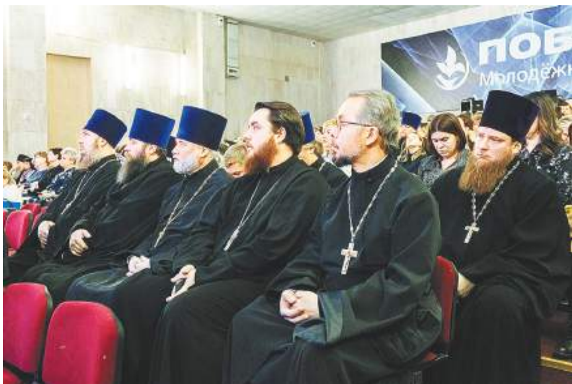
В зрительном зале