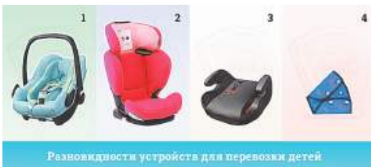
Разновидности устройств для перевозки детей