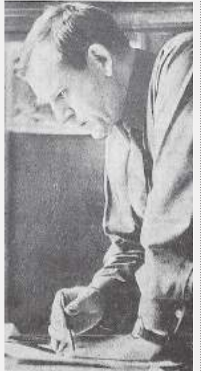
Фото В. Мариньо».

«Интересно оформлена территория на госплемзаводе «Константиново». На каждой ферме есть своя Доска почета, плакаты, показывающие рост производственных показателей. Здесь работает художник Н.Г. Кузнецов . В эти дни, когда вся страна готовится к ленинскому юбилею, у него особенно много работы. Заново оформляются фермы и вьезды на территорию госплемзавода.