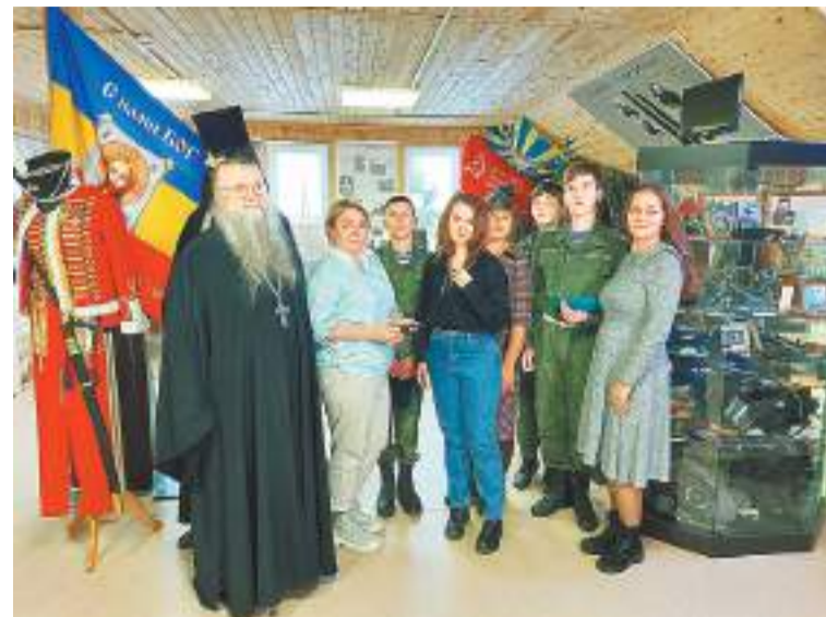
Во время встречи в музее