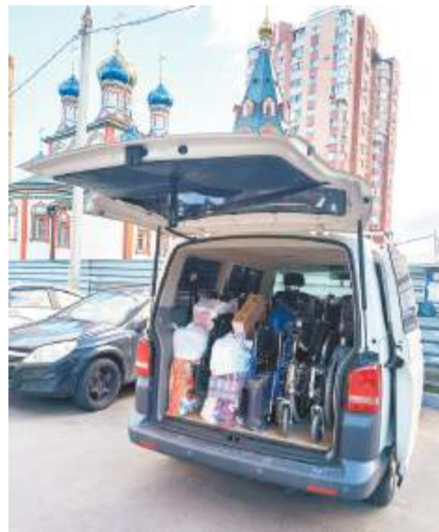
Через минуту – в путь