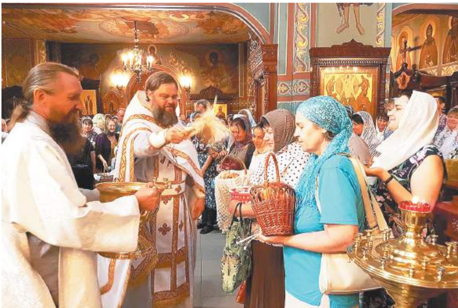
Освящение плодов земных в праздник Преображения Господня

19 августа во всех православных храмах шли богослужения в честь большого праздника – Преображения Господня. В этот день вспоминается евангельская история, повествующая о чуде преображения Господа нашего Иисуса Христа на горе Фавор, свидетелями которого стали три апостола: Иоанн, Иаков и Петр. На Фаворе они молились, и в какой-то момент случилось невероятное: лицо Христа изменилось, а одежды стали такой сияющей белизны, что больно было смотреть. Илья и Моисей, явившиеся в сиянии небесной славы, беседовали со Христом об исходе к смерти и воскресению, который Ему предстояло совершить.