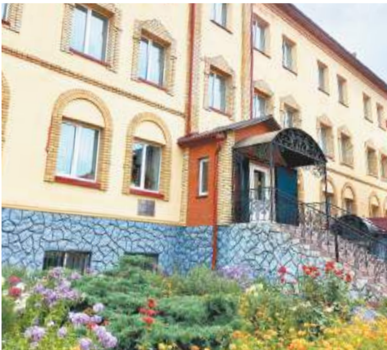
Православная гимназия имени преподобного Серафима Саровского

«Планируем раз в месяц участвовать с ребятами в передачах домодедовского телевидения «Вестник благочиния». Буквально вчера беседовали с представителем телеканала, обсуждали это тему, и я показал те материалы, которые мы готовим обычно, они понравились. Наши десять минут раз в месяц — это, по-моему, очень неплохо. Тем более что ребята сами будут ведущими этих передач. И я вот думаю, неплохо было бы в рамках дополнительного образования организовать у нас