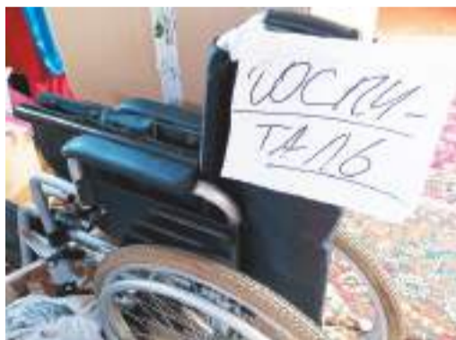
Вещи готовы к отправке