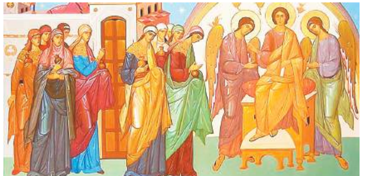
Притча о десяти девах. Фреска