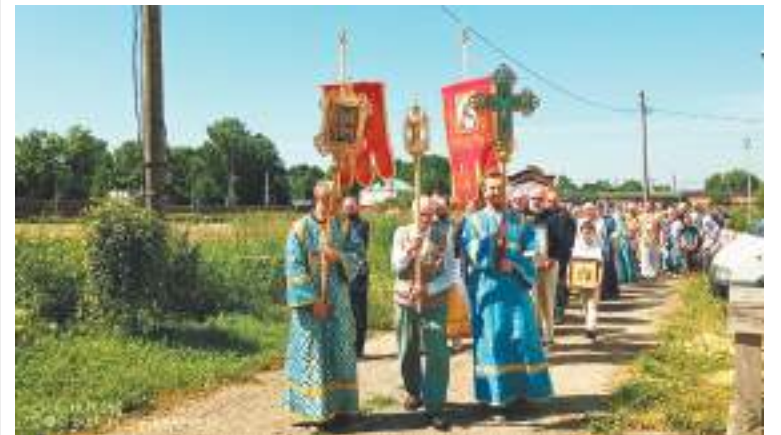
Крестный ход вокруг Успенского собора