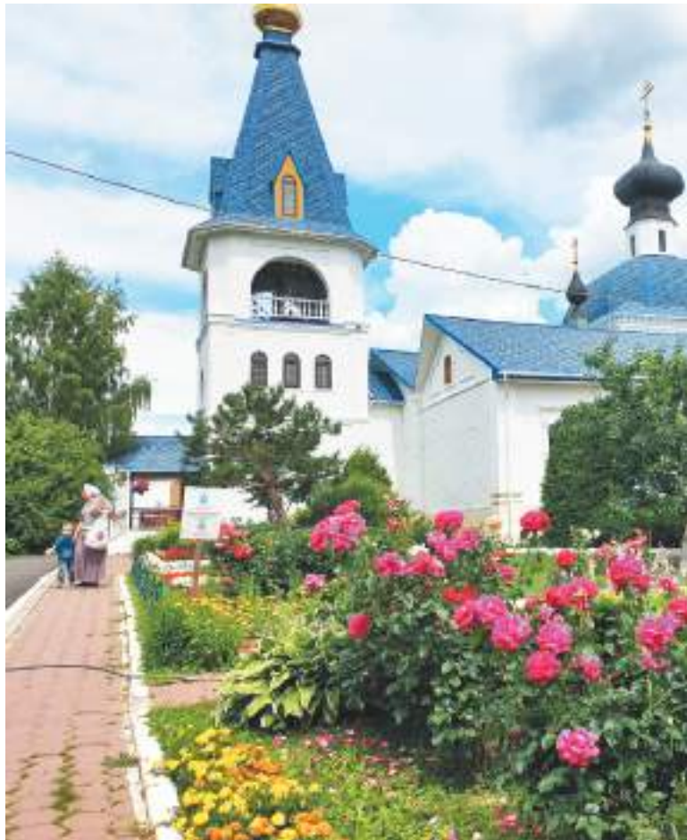
На территории Никольского храма