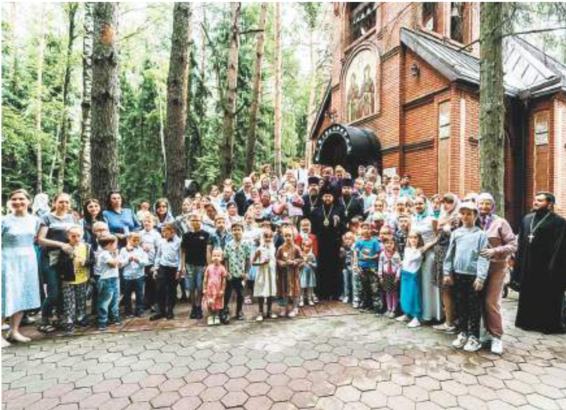
Прихожане и гости храма после литургии. Фото на память о празднике