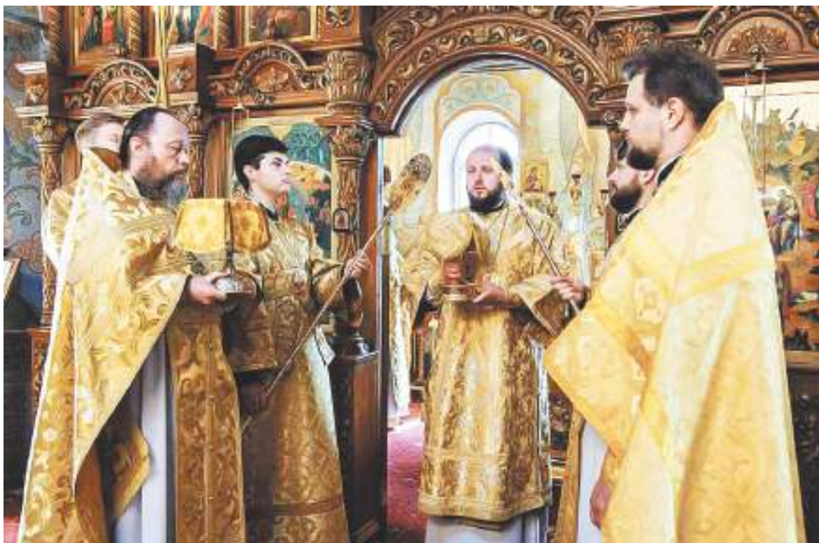
Во время богослужения