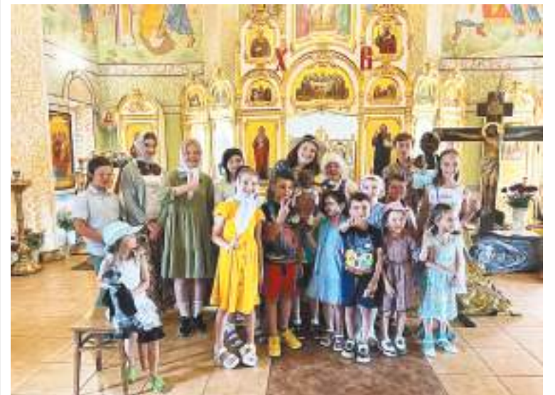
Снимок на память после спектакля

В гости к ребятам из воскресной школы Иоанно-Предтеченского храма микрорайона Востряково приезжал путешествующий семейный театр со спектаклем-притчей «Два медведя». Это была история про то, как можно научиться помогать и, главное, хотеть это делать. Воспитанники воскресной школы храма, в свою очередь, подготовили в подарок артистам рисунки.