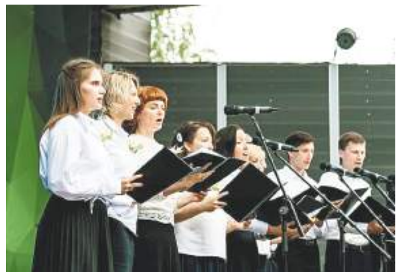
Во время концерта