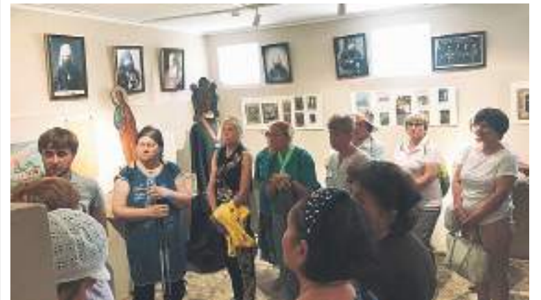
Экскурсанты в приходском музее

В музее новомучеников и исповедников Домодедовских при Флоро-Лаврском храме села Ям прошли экскурсии для участников проекта губернатора Московской области «Активное долголетие». Пожилые жители городского округа Домодедово сначала посетили храм святых Флора и Лавра, где познакомились с его историей и поклонились святыням. Экскурсия продолжилась в музее. Посетители посмотрели фильм и экспонаты, повествующие о жизни и подвиге новомучеников и исповедников домодеевской земли, познакомились с выставкой, посвященной преподобноисповеднице Фамари , осмотрели экспозиционные залы музея, рассказывающие об истории села Ям, комнату священника конца XIX — начала XX века. В «избе ямщика» гостям был предложен чай с пирогами. В книге отзывов музея экскурсанты оставили многочисленные благодарности.