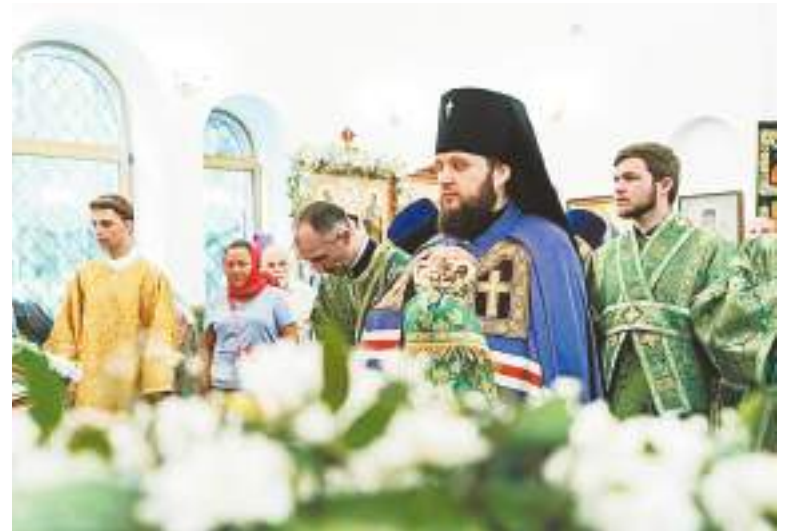
Архиепископ Подольский и Люберецкий Аксий