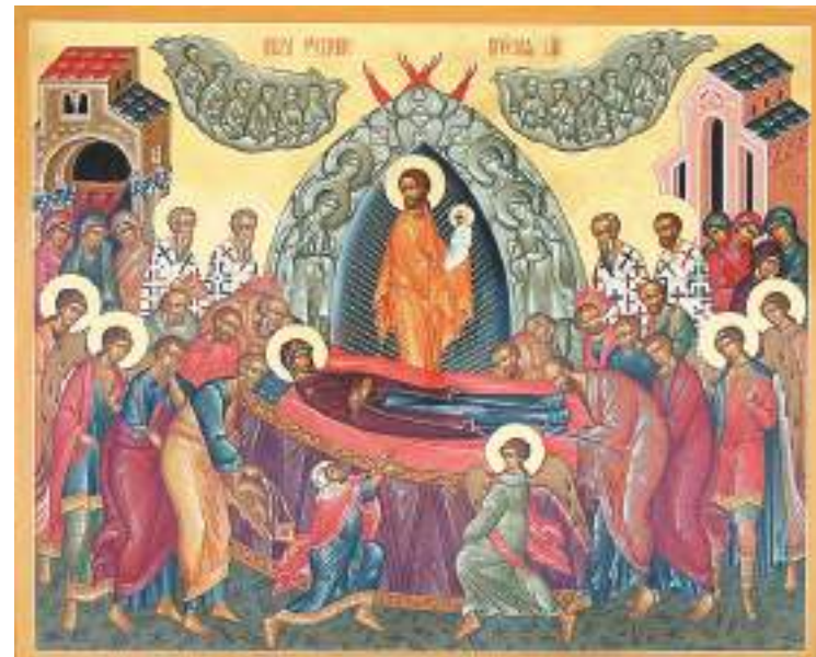
Икона «Успение Пресвятой Богородицы»