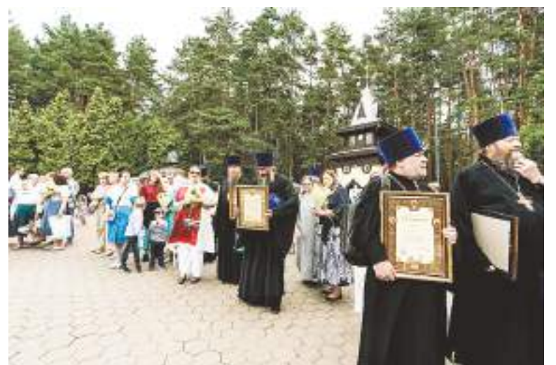
Многие семьи священнослужителей были награждены архиерейскими грамотами