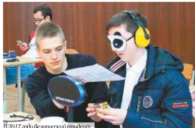
В 2017 году белорусский студент установил мировой рекорд по сборке кубика Рубика на чемпионате в Новополюске – он сумел собрать кубик за 19 ходов. /

Когда мы готовили этот материал, то собирали кубик Рубика всей редакцией