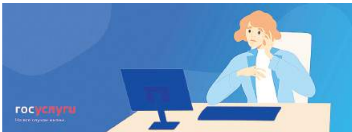
Инфографика портала Госуслуг

Эта система все чаще стала подвергаться атакам мошенников