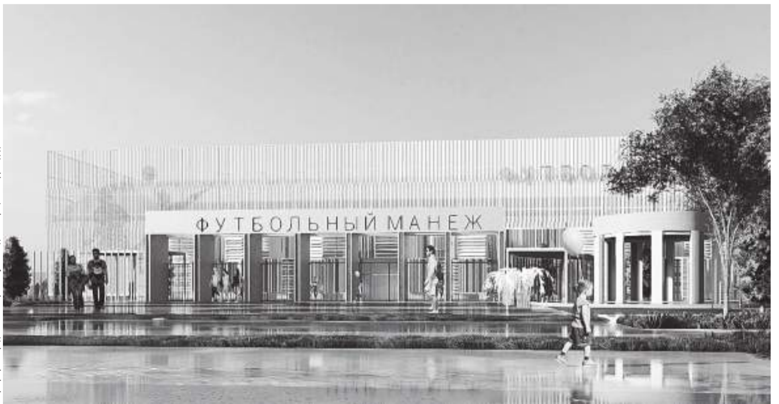
Инфографика предоставлена пресс-службой администрации г. о. Домодедово

На территории городского стадиона «Авангард» приступили к возведению крытого футбольного манежа