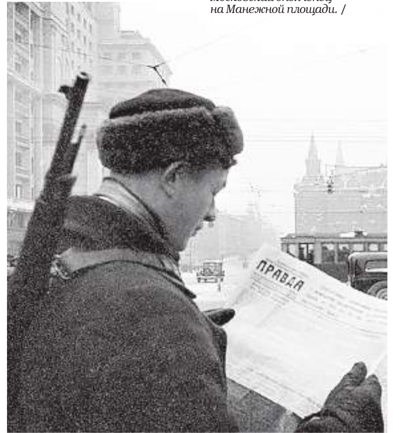
Московский ополченец на Манежной площади. /