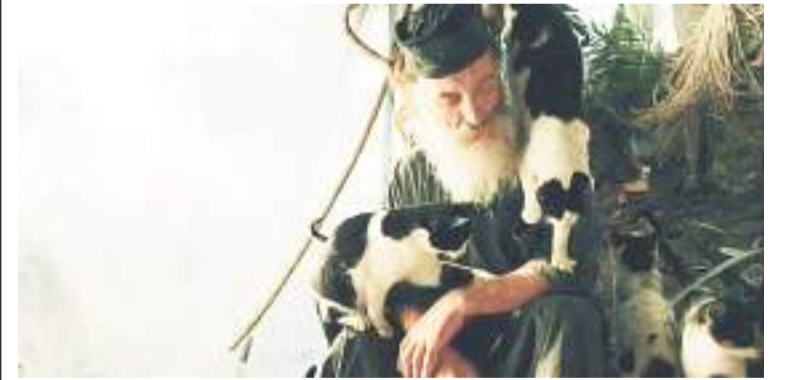
Кадр из фильма «Где ты, Адам?»

30 января в кинотеатре «Матрица» в городском округе Домодедово состоялся показ документального фильма «Где ты, Адам?».