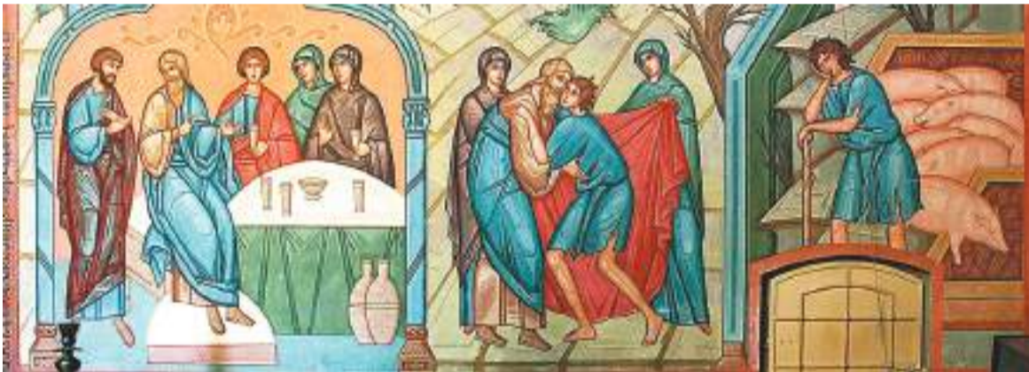
Притча о блудном сыне, роспись церкви Покрова Пресвятой Богородицы в Затьмачье в Твери

остается наедине с самим собой и впервые заглядывает в свою душу. Освободившись от всех обольщений и соблазнов, лжи и приманок, которые он принимал за освобождение и полноту жизни, он вспоминает детство, когда у него был отец и он не должен был, словно сирота, скитаться без крова и пищи. Ему становится ясно, что нравственное убийство, которое он совершил, убило не отца, а его самого, и что та беспредельная любовь, с которой отец отдал свою жизнь, позволяет ему сохранять надежду. И он встает, оставляет свое жалкое существование и отправляется в дом отца с намерением пасть к его ногам в надежде на милость. Но не только воспоминание картины домашнего уюта — огня в очаге и накрытого к обеду стола — заставляет его возвратиться; первое слово его исповеди не «прости», а «отец». Он вспоминает, что на него была безгранично излита любовь отца, а из нее происходили и все блага жизни. (Христос сказал: «Ищите же прежде Царства Божия... и это всё приложится вам».) Он возвращается не к чужому человеку, который не признает его, которому придется говорить: «Разве ты не помнишь меня? Когда-то у тебя