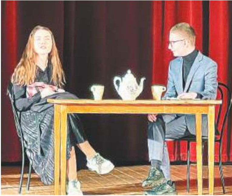
Сцена из спектакля «Когда закончится урок»

Театральная группа православной гимназии имени Серафима Саровского приняла участие в фестивале «Рождественское СО-БЫТИЕ».