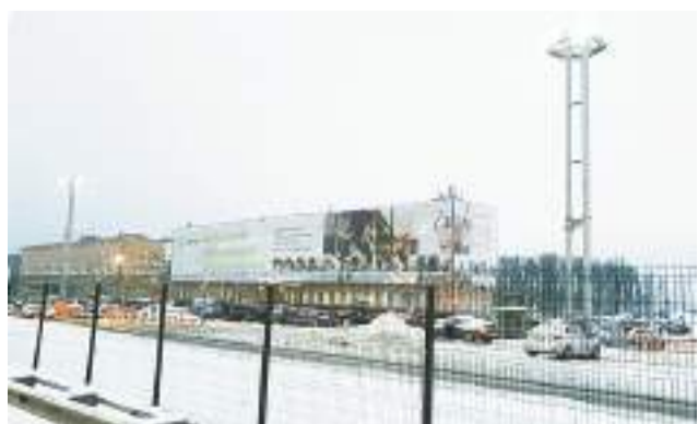
Фотография рекламной конструкции по адресу: Московская область, г. Домодедово, территория «Аэропорт «Домодедово», строение 6/2, установленной без действующего разрешения, принадлежащей ПАО «Авиакомпания «Сибирь».

Приложение к постановлению администрации городского округа Домодедово Московской области от 22.02.2022 № 481