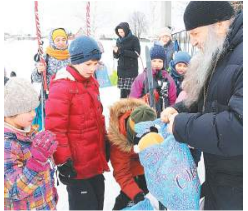
Подарки от батюшки