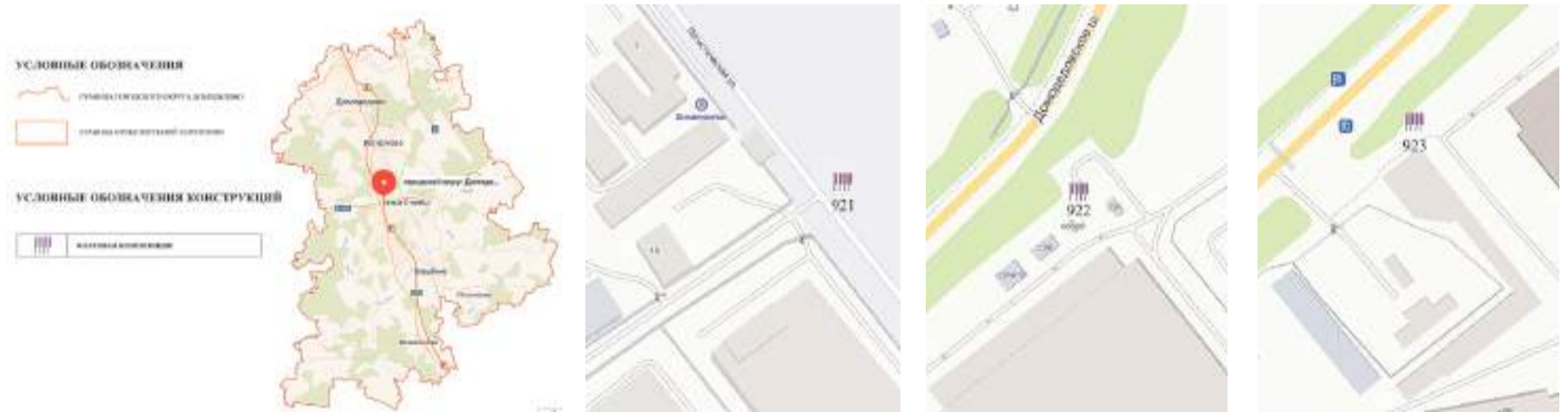
Схема размещения рекламных конструкций на территории городского округа Домодедово Московской области