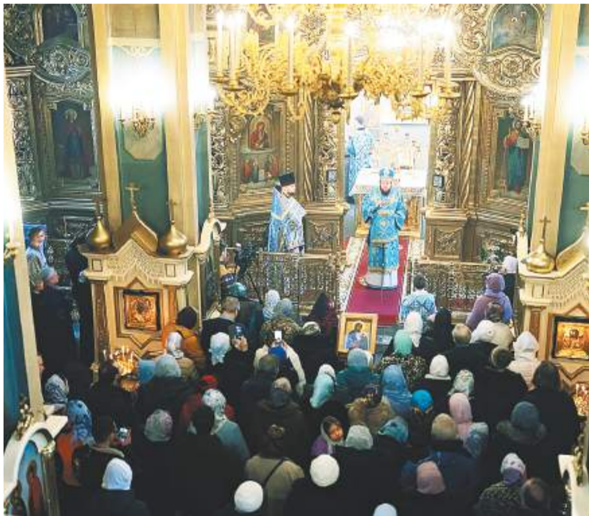
Во время архиерейского богослужения в храме иконы Богородицы «Утоли моя печали»

У храма в честь иконы Пресвятой Богородицы «Утоли моя печали» в селе Одинцово совершенно особая история – его община гораздо старше, чем сам храм. До него прихожане молились в церкви Михаила Архангела, который находится на территории дома отдыха ВЦСПС, и в то время, когда храмы повсеместно передавались верующим, общине данного храма в этом было отказано. Но невдалеке, в чистом поле, в кратчайшие сроки был построен красивый храмовый комплекс – в ноябре этого года исполнится 20 лет, как состоялось освящение главного его престола в честь иконы Божией Матери «Утоли моя печали». Спустя некоторое время, 2 февраля 2004 года, был освящен престол нижнего