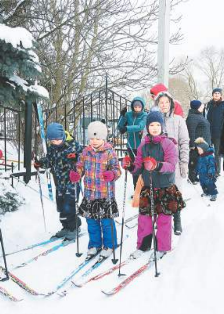
В забеге участвовали и взрослые, и дети