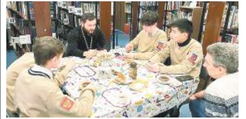
Разговор со священником

3 февраля в храме Петра и Февронии, что в парке «Ёлочки», вновь прошла акция «Добро вокруг». Ученики домодедовской школы № 10 оказали помощь в расчистке от снега храмовой территории.