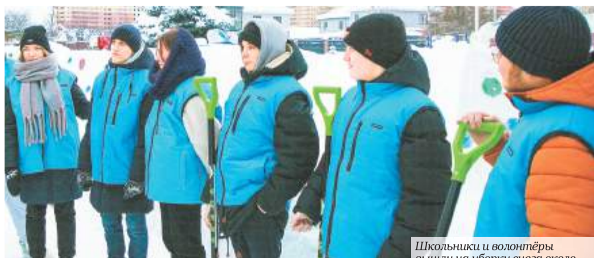
Школьники и волонтеры вышли на уборку снега около домодедовской школы № 2. /

Общественная палата округа объявила снежный субботник