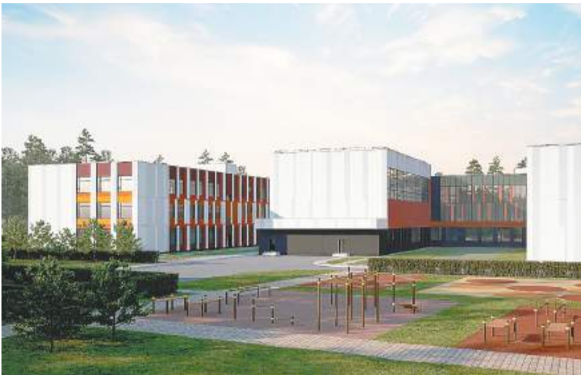
Эскиз проекта предоставлен пресс-службой администрации г. о. Домодедово

Какие планы будут реализованы в микрорайонах Барыбино и Белые Столбы в 2022 году