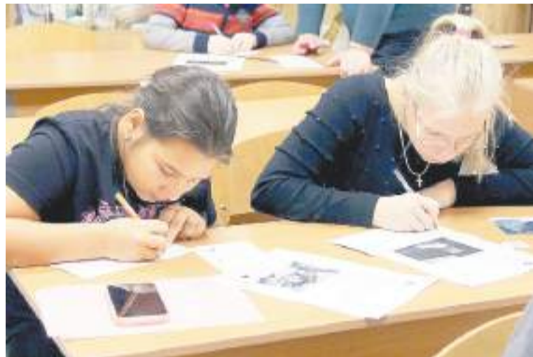
Ребята с увлечением подписывали открытки