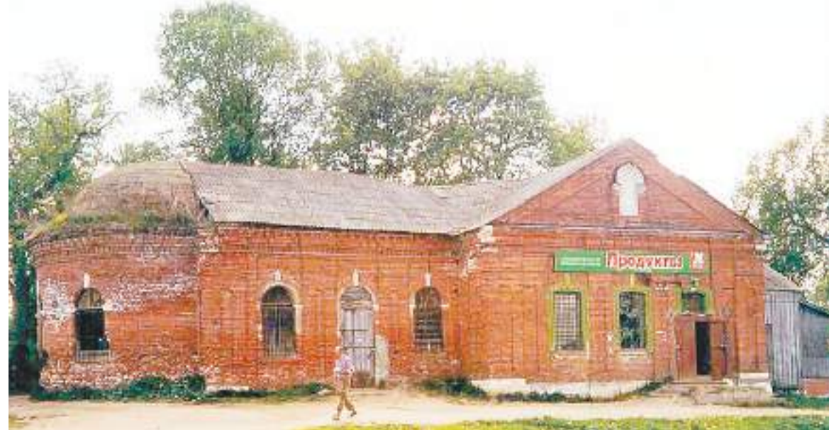
Здание храма до передачи его верующим

Алла ЧМИРКОВА, прихожанка Сергиевского храма села Кишкино.