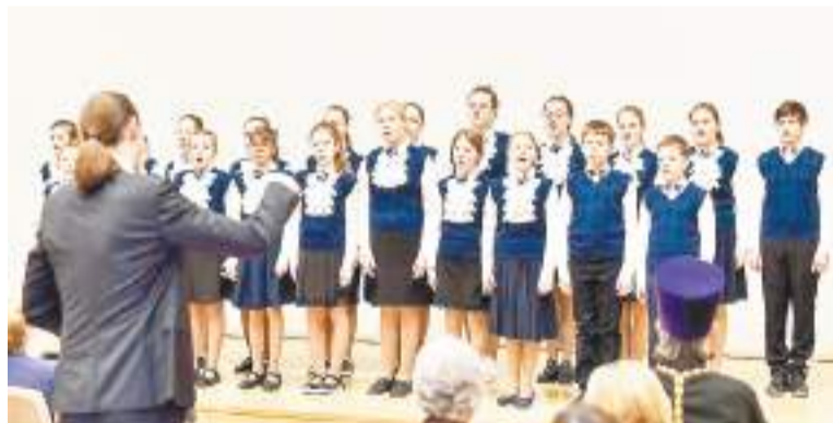
Выступление гимназического хора