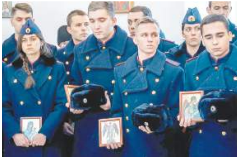
Каждый из молодых следователей получил икону

9 декабря Следственный комитет Российской Федерации отмечает памятную дату истории – День основания «Майорских следственных канцелярий», явившихся прообразом современных следственных органов Российской Федерации.