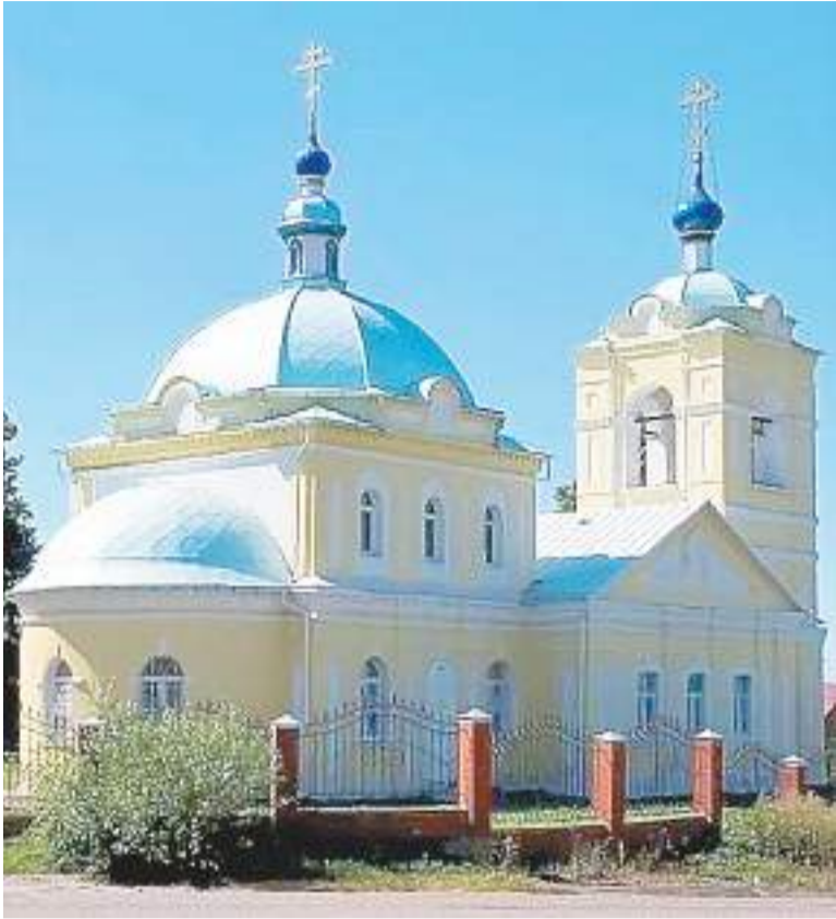
Сергиевский храм в селе Кишкино

В центре села Кишкино, как на островке, расположен красивый Сергиевский храм, который виден издали. В октябре этого года исполнилось 20 лет со дня его восстановления. Всякий юбилей – время подведения итогов, когда уместно говорить о достижениях и намечать планы на будущее. Поэтому правильным будет обратиться к истории восстановления храма.