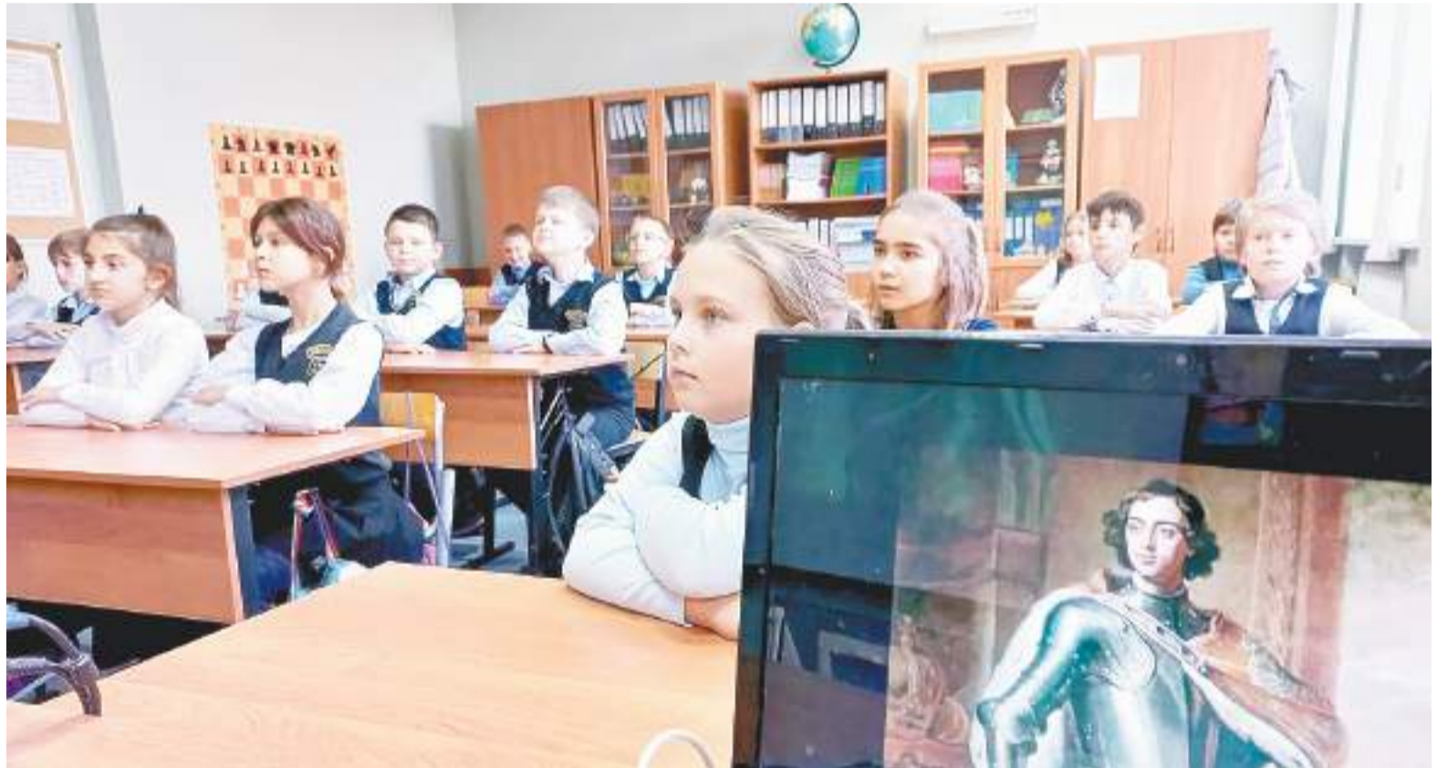
Просмотр фильма на открытии чтений

Второй старинный храм, тоже освещенный в честь Воскресения Словущего, находится в селе Кольчево. Ему более трехсот лет.