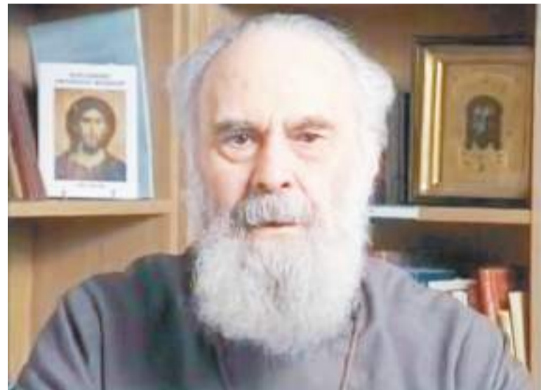
Митрополит Антоний Сурожский

И вот дальше нам дано слово, предостережение святого