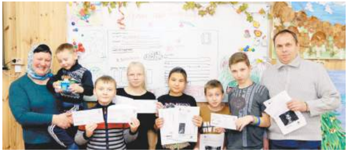
Участники благотворительного проекта «ДоброПочта»