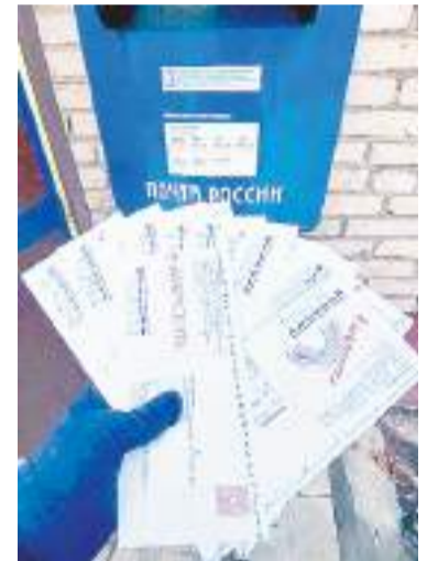
Конверты отправляются в почтовый ящик