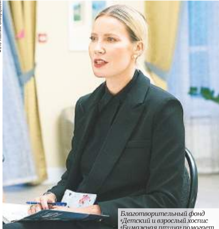
Благотворительный фонд «Детский и взрослый хоспис «Бумажная птица» помогает неизлечимо больным детям с 2003 года. /