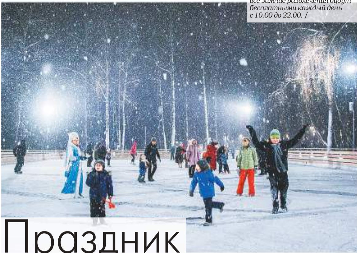
В городском округе Домодедово все зимние развлечения будут бесплатными каждый день с 10.00 до 22.00.