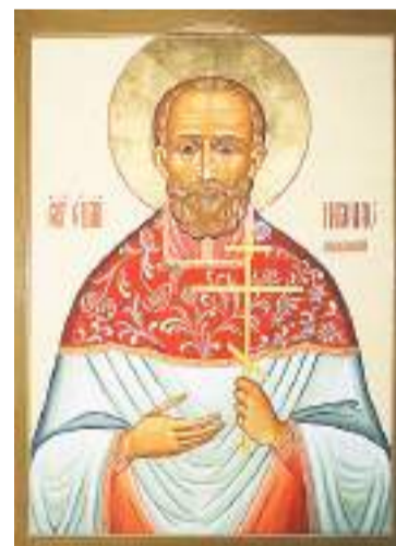
Икона священномученика Николая Добролюбова