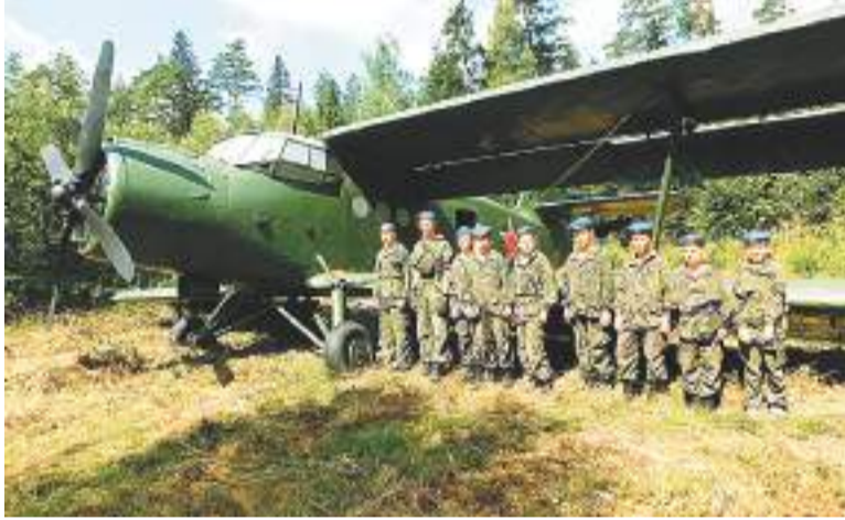
Эта земля помнит...

Курсанты православного казачьего военно-патриотического клуба «Домодедовская дружина имени благоверного князя Владимира Храброго», учащиеся молодежного центра «Альбатрос» (юнармейцы городского округа Домодедово) совершили традиционный пеший поход по местам боев времен Великой Отечественной войны на территории национального парка «Угра» в районе села Климов Завод Юхновского района Калужской области.