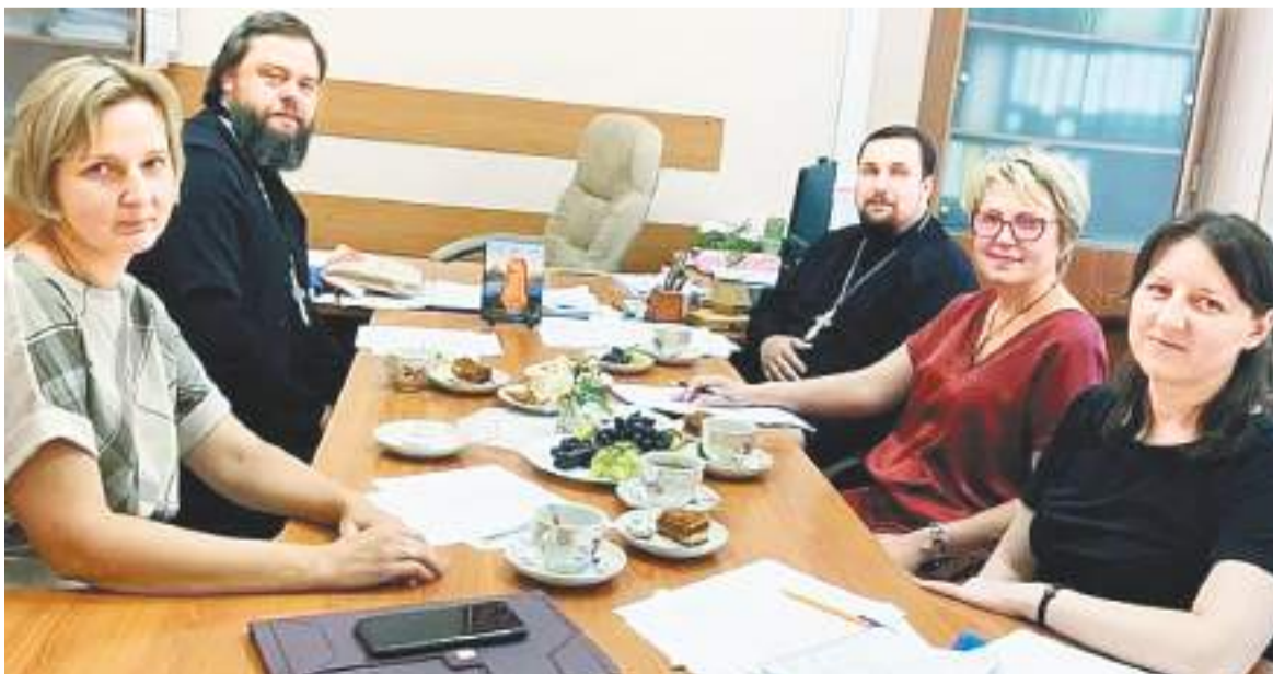
Участники координационного совета

19 августа 2021 года состоялось первое в новом учебном году заседание координационного совета по взаимодействию между управлением образования администрации городского округа Домодедово и Домодедовским благочинием.