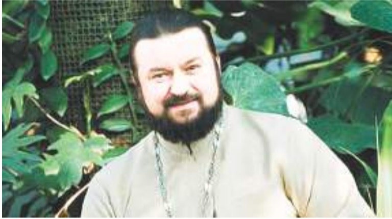
Протоиерей Андрей Ткачев

Любить Христа можно так, как любит царя верноподданный, живущий за тридевять земель. В лицо не видел, в глаза не смотрел, но сердцем любит. На стену прикрепил вырезку с портретом из журнала, в царские дни работать отказывается.