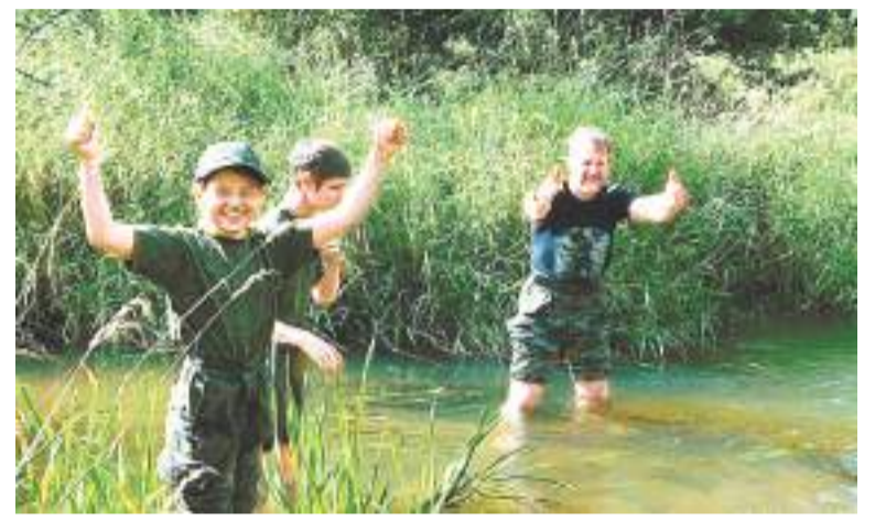
Радость жаркого дня