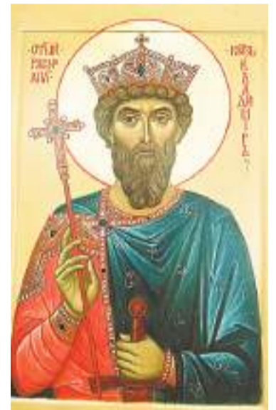
Икона святого равноапостольного князя Владимира. Иконописец Оксана Богданова