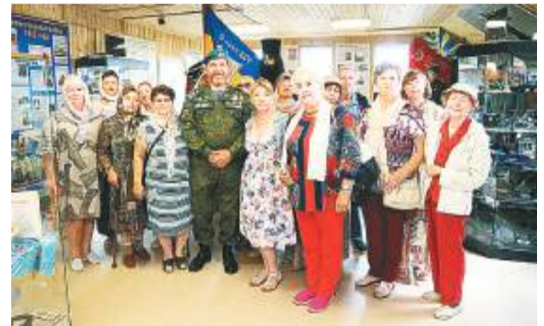
Гости из Луховиц в приходском музее

Приходской музей «Церковь и армия. Союз во имя жизни» и Никольский храм села Лямцино посетили члены клуба «Активное долголетие» из города Луховицы.