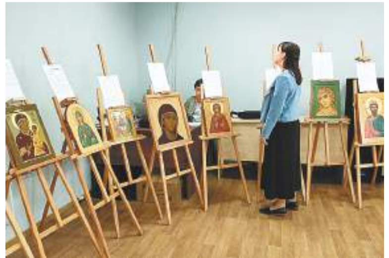
На выставке икон