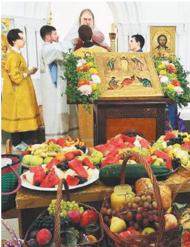
Праздник Преображения Господня в Никитском храме села Никитское

Светлана ГОНЧАРОВА.