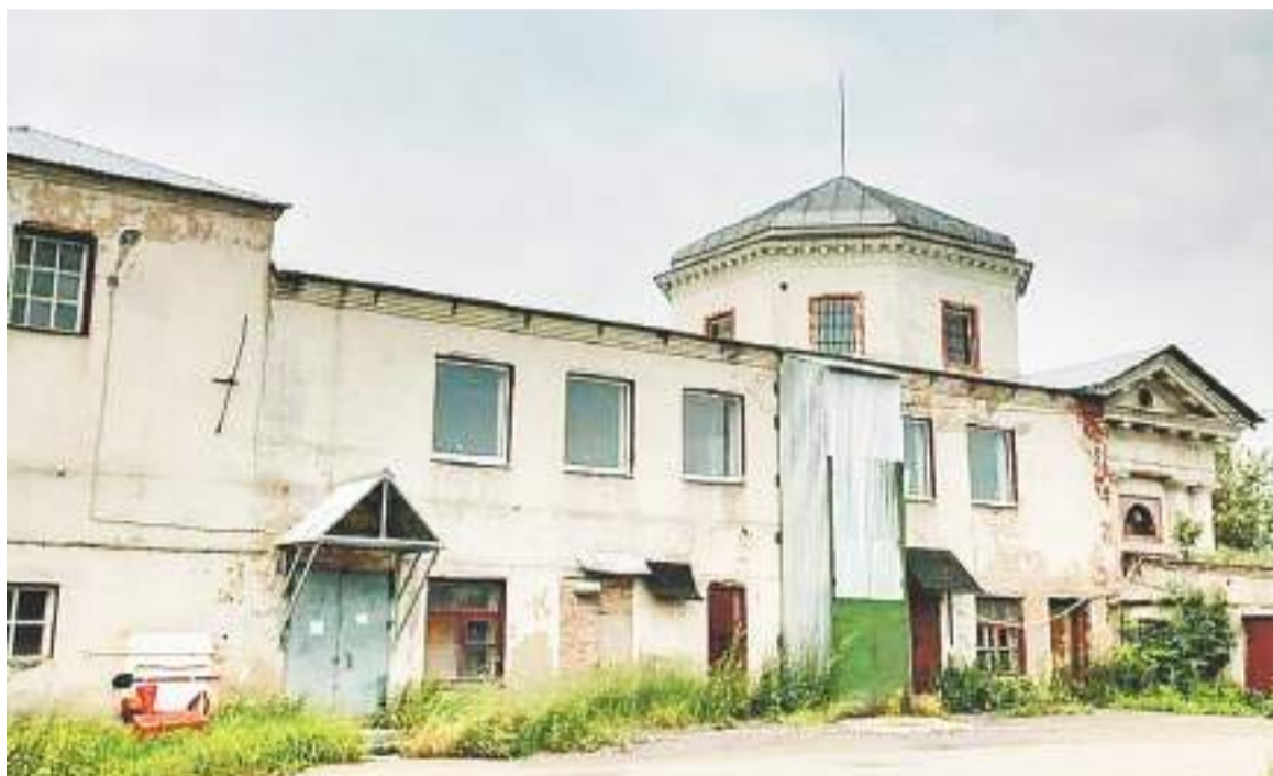
Борисоглебский храм сегодня

Светлана ГОНЧАРОВА. Фото из архива храма.