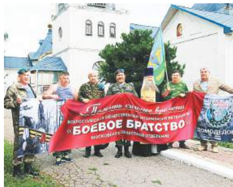
Ветераны на территории храма