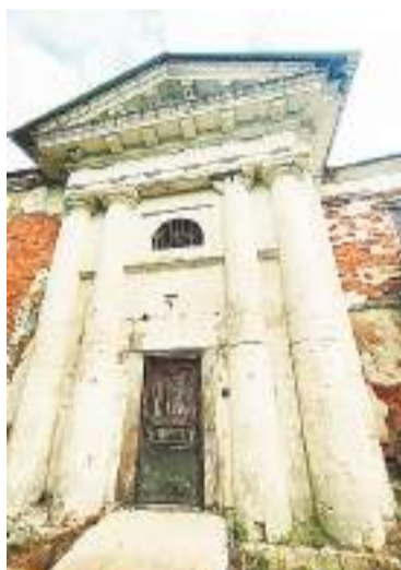
Вход в храм