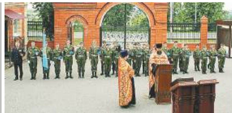
Дружинники во время молебна