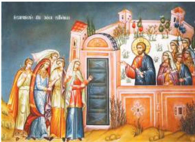
Притча о десяти девах. Фреска

Вдумаемся в эти разные образы, опомнимся и станем жить не узкой, бедной жизнью, которая вся заключается в нас самих, а той просторной, глубокой, мощной жизнью, которая покоится в Боге, которая из Него получает источник безграничной силы и которая нас уносит в вечность, где всё имеет свое место, где всё получает величие, потому что благодатью Святого Духа, любовью Господней человек может себя перерасти и стать богочеловеком по подобию Иисуса Христа. Аминь.