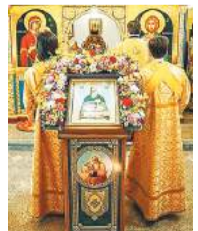
Икона святого праведного Иоанна Кронштадтского