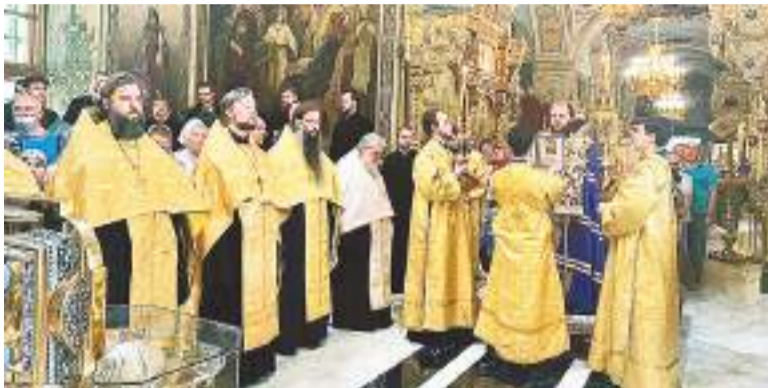
Молебен с акафистом святому благоверному князю Александру Невскому