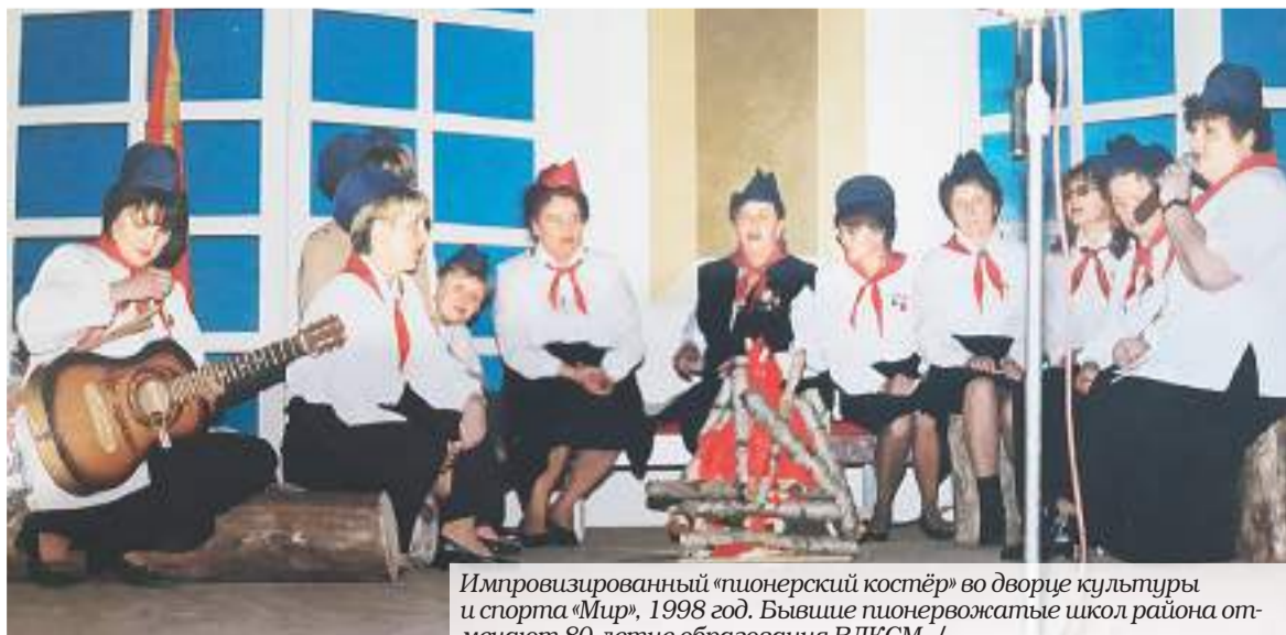
Импровизированный «пионерский костёр» во дворце культуры и спорта «Мир», 1998 год. Бывшие пионервожатые школ района отмечают 80-летие образования ВЛКСМ. /

От редакции: В следующих номерах «Призыва» мы еще не раз вернемся к теме зарождения и работы пионерской организации в Домодедове и расскажем о самых ярких страницах её истории.