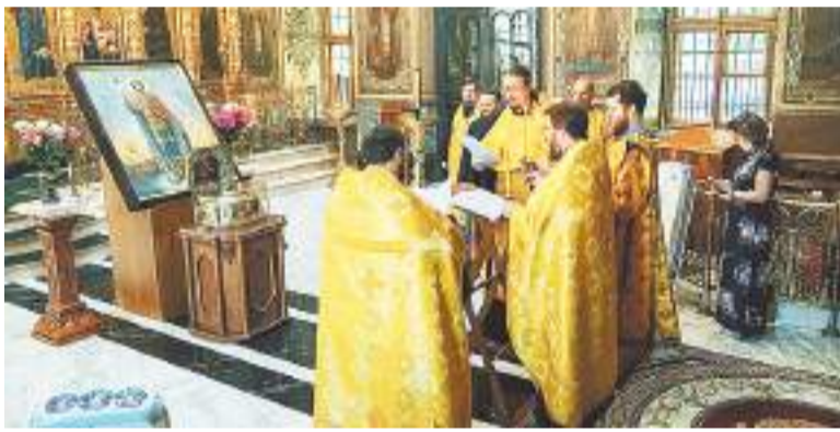
Домодедовские священнослужители во время молебного пения перед ковчегом святого