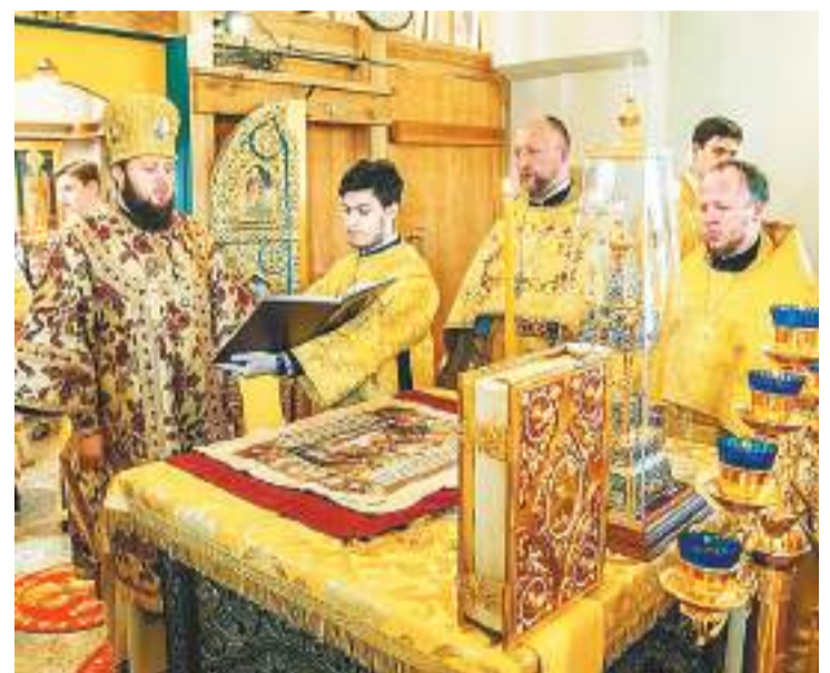
Во время богослужения