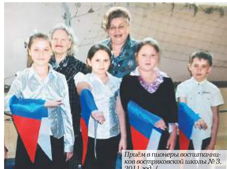
Приём в пионеры воспитанников востряковской школы № 3, 2011 год. /